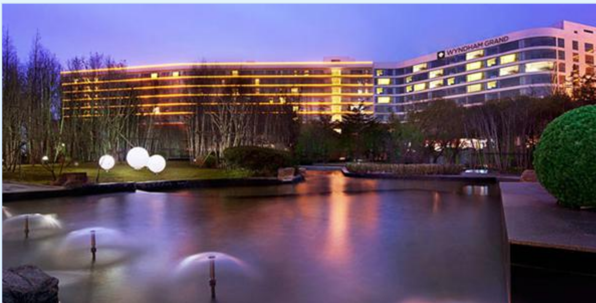
青岛银沙滩温德姆至尊酒店 地址：山东省青岛市黄岛区银沙滩路 178 号